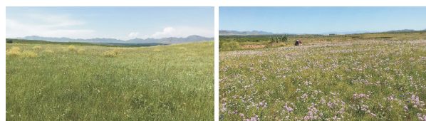
图1 试验地草地景观图

试验地面积为20 hm 2 ,试验小区面积为16 m 2 (4 m×4 m),3次重复,在2017年7月20日、8月1日、8月10日、8月20日、8月30日和9月10日分别对试验小区内天然牧草种类、植被分布进行调查(图1),针茅属牧草刈割后立即放置在塑封袋内,带回实验室利用粉碎机对样品进行粉碎,过40目筛子后将部分样品装至信封袋,用以测定中性洗涤纤维和酸性洗涤纤维;剩余样品过100目筛子后装至信封袋,用以测定营养成分。